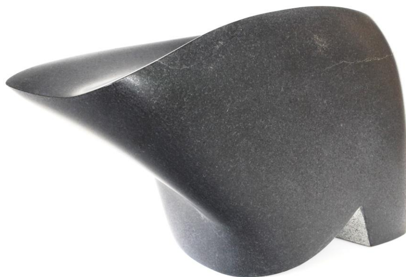
「黒い月」180×250×120mm 2013年 黒御影石 大島由起子作