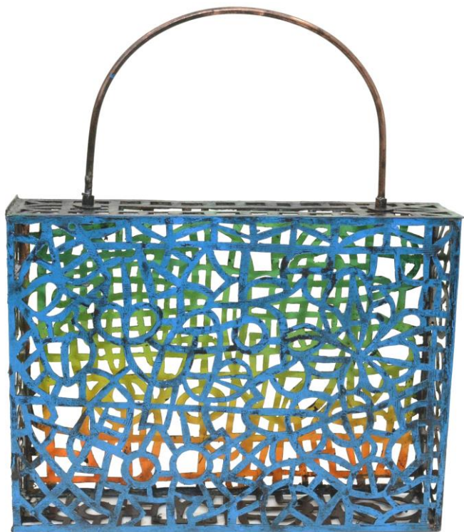
「銅花入籠」37×31×7 cm 2014年 銅板、半田、エッチング、インク 池垣タダヒコ作